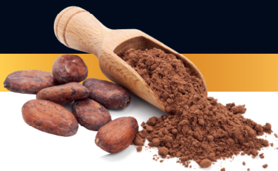
Cacau em Pó 50%