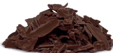
Chocolate Meio Amargo