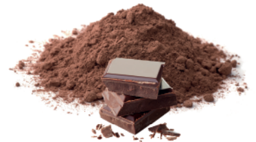
Pó para preparo de Fondue Zero