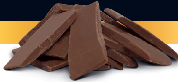
Chocolate ao Leite