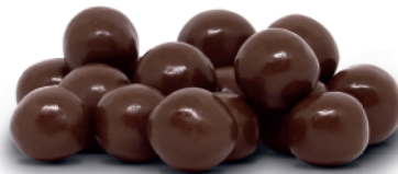
Divis Chocolate Zero 50% Cacau