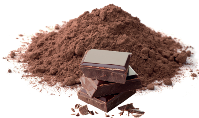
Pó para preparo de Fondue