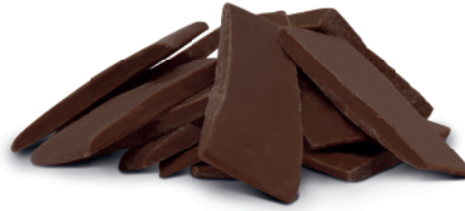
Chocolate Meio Amargo