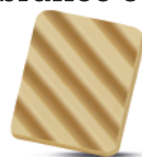
Lâmina Chocolate branco 5g