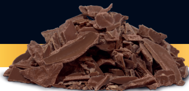
Chocolate ao Leite