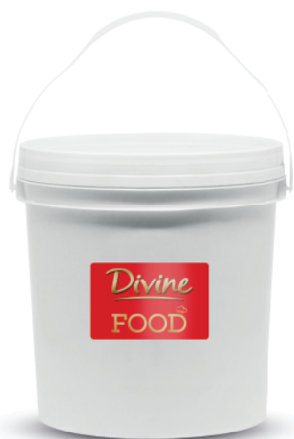
Forneável Sabor Avelã